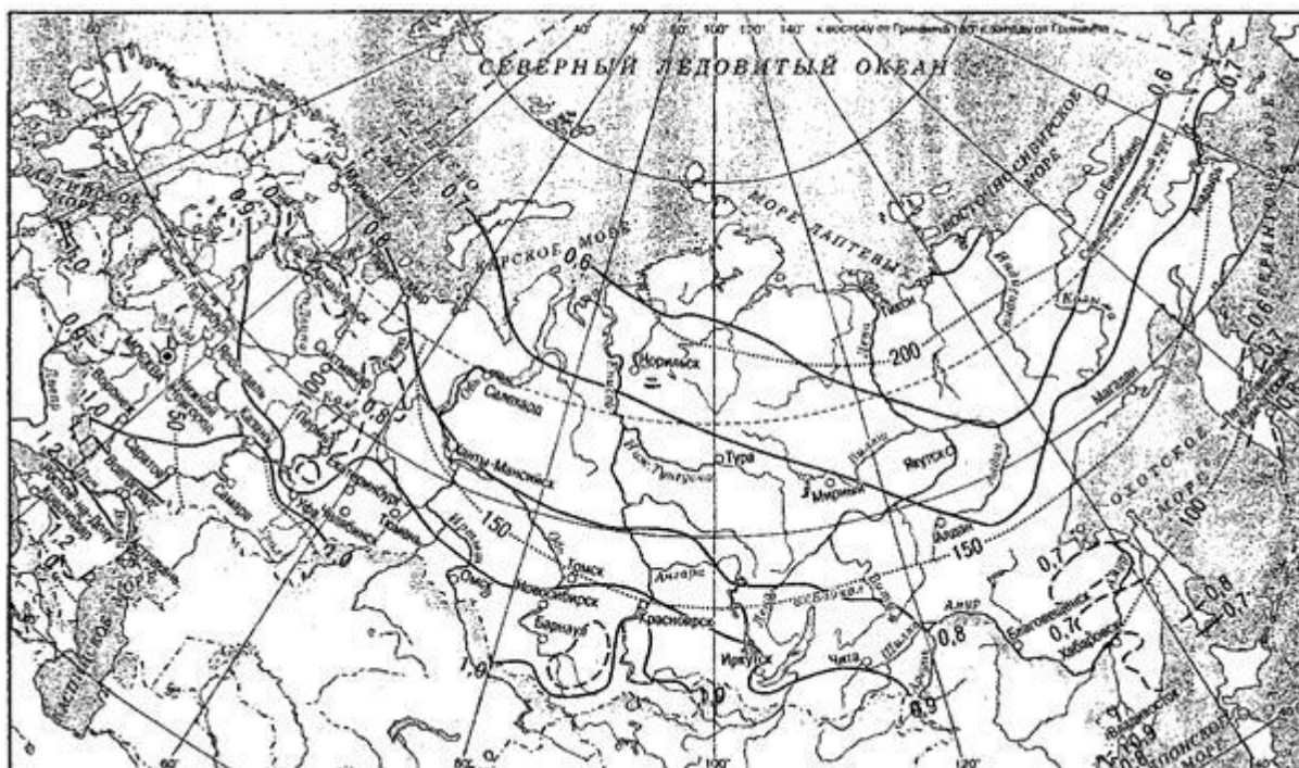
Рисунок 1 - Климатические коэффициенты для определения величины нагрузки на иловые площадки (сплошные и пунктирные линии) и продолжительности периода намораживания на иловых площадках, дни (точечные линии)

9.2.14.39 Площадь иловых площадок следует проверять на намораживание. Продолжительность периода намораживания следует принимать равной числу дней со среднесуточной температурой воздуха ниже минус 10 °С. Количество намороженного